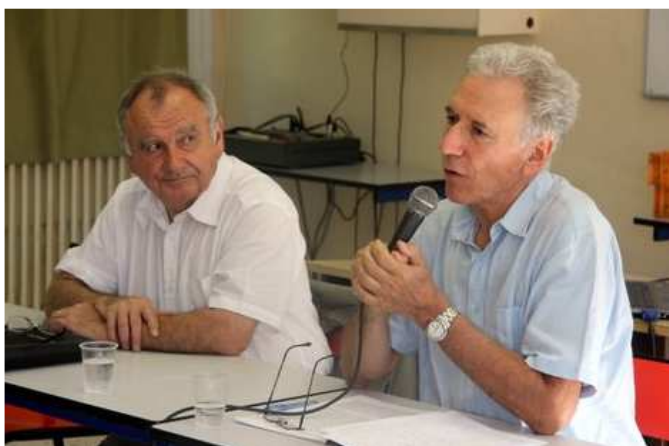
Conférence de Pena Ruiz