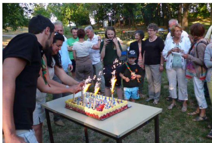
Gâteau des 60 ans