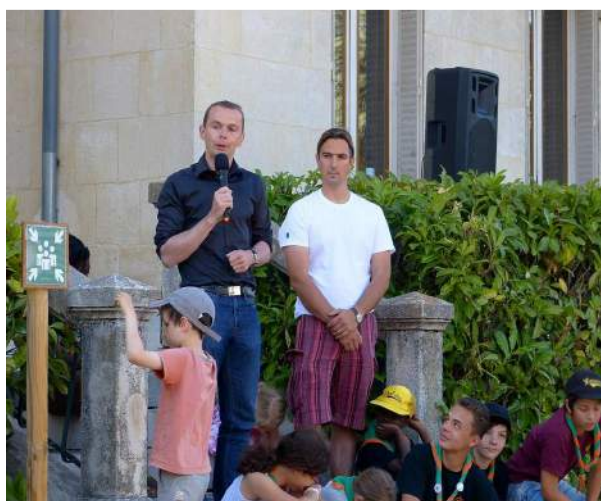
Le temps des discours